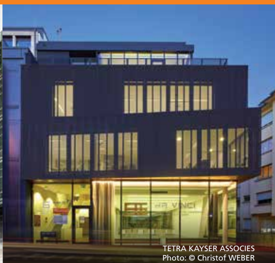
TETRA KAYSER ASSOCIES