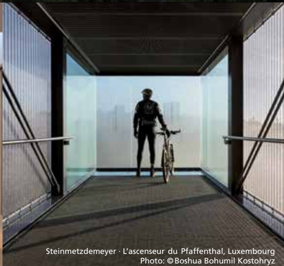
Steinmetzdemeyer · L'ascenseur du Pfaffenthal, Luxembourg