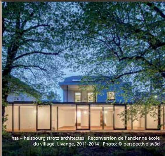
hsa – heisbourg strotz architectes · Reconversion de l'ancienne école du village, Livange, 2011-2014 ·