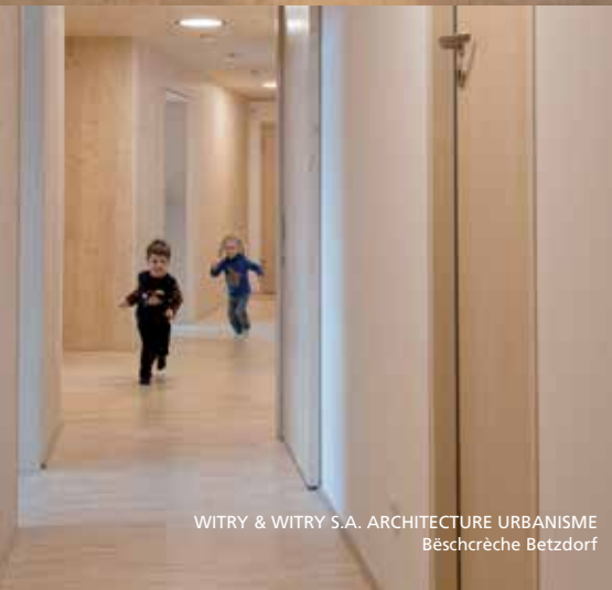
WITRY & WITRY S.A. ARCHITECTURE URBANISME Bëschrëche Betzdorf