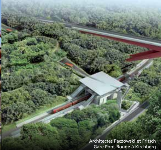
Architectes Paczowski et Fritsch Gare Pont-Rouge à Kirchberg