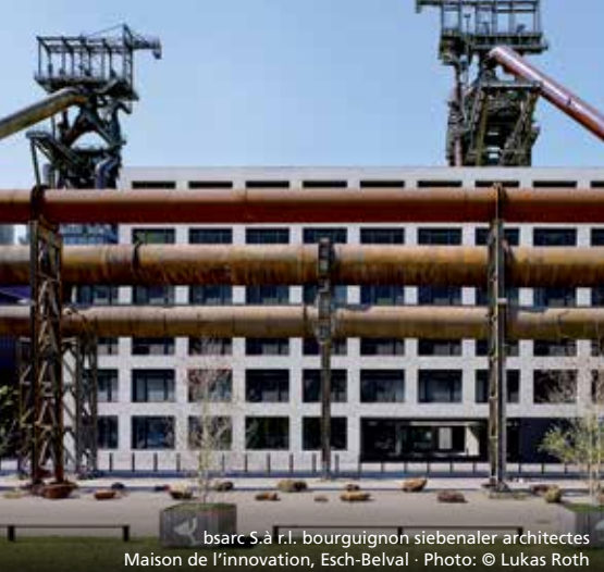
bsarc S.à r.l. bourguignon siebenaler architectes Maison de l'innovation, Esch-Belval · Photo: © Lukas Roth