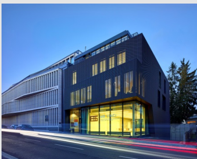
Arc. TETRA KAYSER ASSOCIES

Plus d'informations sous www.oai.lu/formation