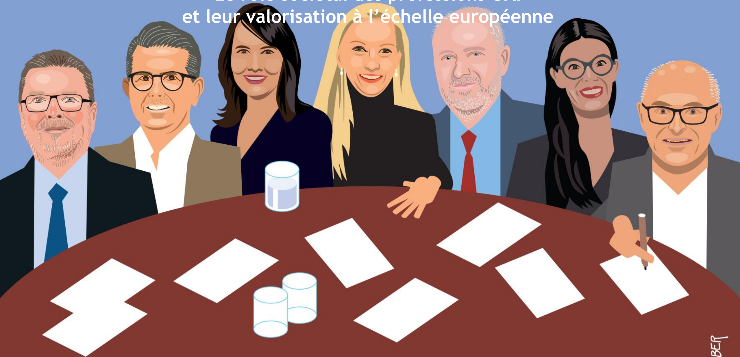
Table ronde OAI Le rôle sociétal des professions OAI et leur valorisation à l'échelle européenne