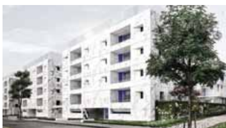
Kapzul architectes et Kubota & Bachmann architects MOZ Paysage