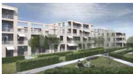
Michel Petit architecte et Schilling Architekten Lützow 7 C.Müller J.Weherberg Landschaftsarchitekten