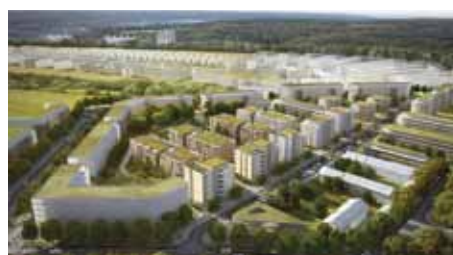
Paul Majerus architectes Olm paysagistes