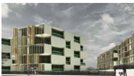
Valentiny hvp architectes Kamel Louafi Landschaftsarchitekten