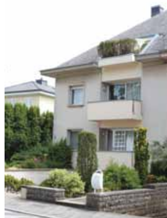
Maison à Weimershof

Les moyens financiers sont tels que l'administration peine à concrétiser l'important programme d'investissement du Gouvernement. Le pays se dote de l'infrastructure répondant aux besoins d'un Etat en plein essor : on construit des bâtiments administratifs, des bâtiments scolaires et sportifs, des maisons de retraite et on modernisait de nombreux bâtiments existants.