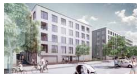
Polaris architectes et Atelier Kempe Thill architects Bureau Bas Smets paysagistes