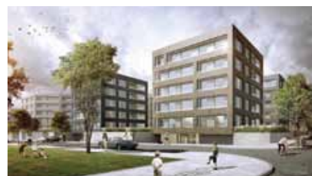
AllesWirdGut Architektur PlanSinn Büro für Planung und Kommunikation GmbH