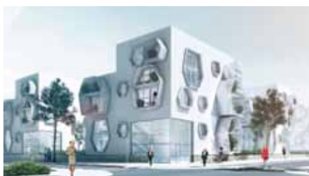
Ofis arhitekti d.o.o.architectes Bassinnet Turquin Paysage