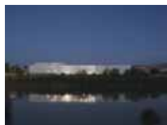
Conférence «Memory & Invention»