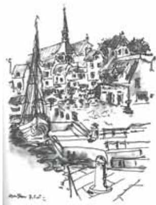
Honfleur, extrait de «La quatrième saison T1»