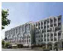
Hôtel Le Royal