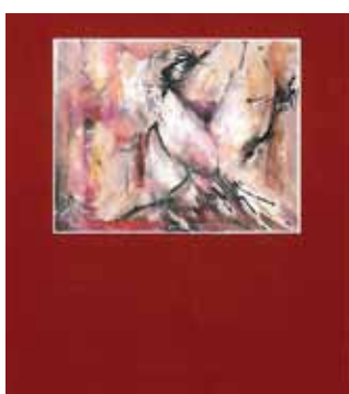
Exposition «Arrière Pays»