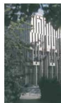
Centre financier Paribas