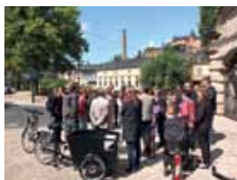
«Walk & Talk»