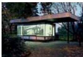
Exposition «Luxembourg moderne»