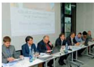
Photo de l'assemblée générale

L'Ordre des Architectes et des Ingénieurs-Conseils (OAI) a tenu le 25 octobre 2012 son assemblée générale ordinaire au siège OAI - Forum da Vinci à Luxembourg.