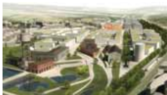
«Le projet Neischmelz à Dudelange»