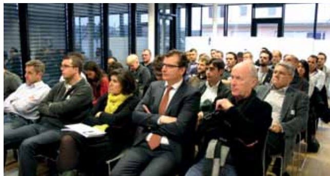
Module 3 du 15/11/2012 : «Législation et jurisprudence dans un projet de construction et d'infrastructure»