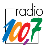
TABLE RONDE OAI EN COLLABORATION AVEC RADIO 100,7 «MISSION IMPOSSIBLE?» LE 26 NOVEMBRE 2012

Des visites de la Ville de Luxembourg ont été organisées le 17 novembre 2012, dont notamment une visite du plateau du Kirchberg avec Marianne BRAUSCH , architecte au Fonds Kirchberg.