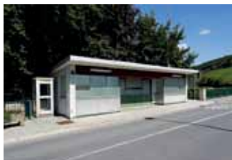
«Lieux de passage»