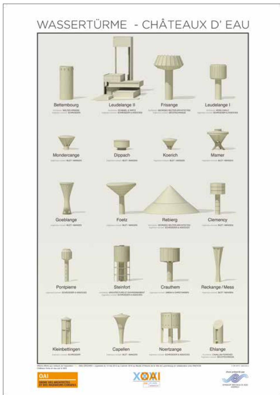
Affiche offerte aux visiteurs de l'exposition OAI « BAU-ZEICHEN » organisée du 13 mai 2015 au 3 janvier 2016 au Musée d'Histoire de la Ville de Luxembourg.