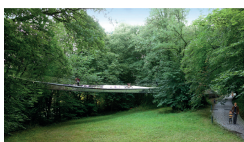
Illustrations extraites du Guide OAI Références 2022, qui reprend en détail les concepteurs des projets présentés cf. www.guideoai.lu